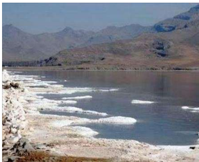
شکل ۴- پارک ملی ارومیه