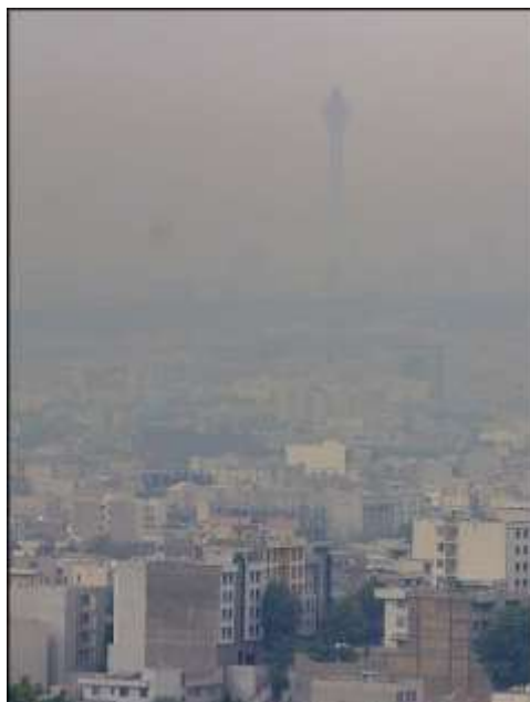
شکل ۳- آلودگی هوا در تهران