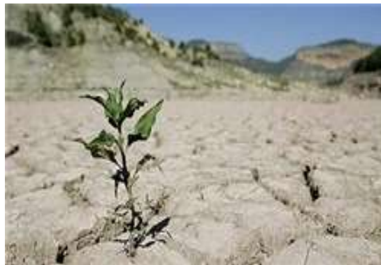
شکل ۱- تالاب بین المللی هامون

۱- خشک شدن تالاب بین المللی هامون در جنوب شرق کشور و امتناع دولت های حال و قبلی افغانستان در ارایه حق آب ورودی به ایران