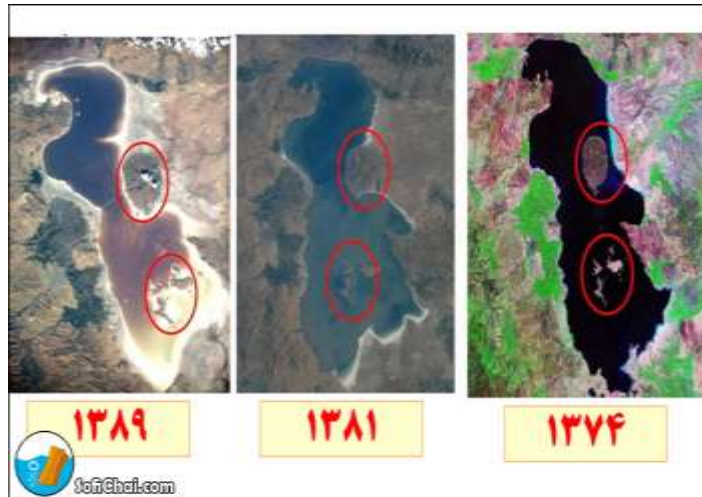
شکل ۵- آلودگی روزافزون منابع آبی و عدم مدیریت صحیح در زمانهای خشک سالی