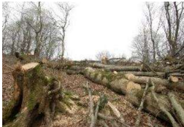
شکل ۲- نابودی جنگلها

۲- تخریب جنگل و کاهش هر ساله مساحت جنگلهای کشور ایران که به دلیل چرای دام، فقر اقتصادی جنگل نشینان و سایر موارد مرتبط